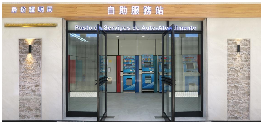
A entrada do Posto de Auto-Atendimento da DSI, em Coloane